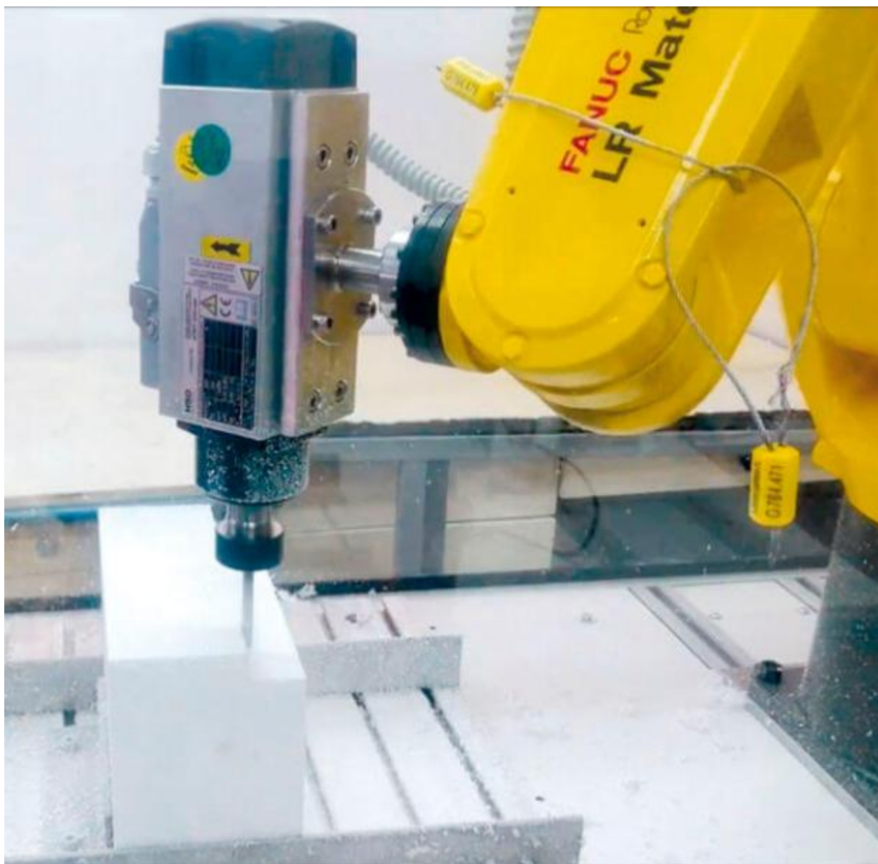
Robotska ruka omogućava rad sa komadima veličine do 570x400x500mm.